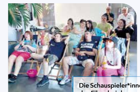
Die Schauspieler*innen des Films bei der Preview am 18. Juli.

Wollt Ihr den Film mal anschauen? Dann klickt auf