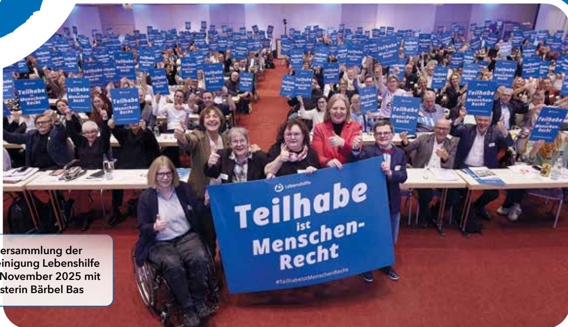
Mitgliederversammlung der Bundesvereinigung Lebenshilfe am 14./15. November 2025 mit Arbeitsministerin Bärbel Bas