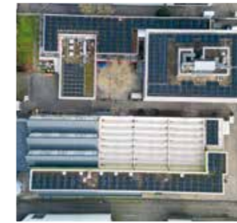
Hagsfeld 1/ Bernd Renner/BEG Durmersheim