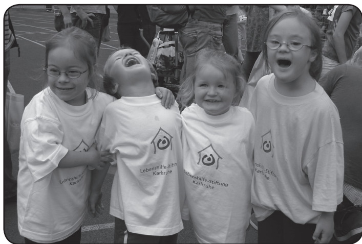
entspanntes Warten auf den Start

Am 17. September 2011 war es mal wieder soweit: Die gemeinsame Teilnahme am Bambinimarathon stand auf dem Programm.