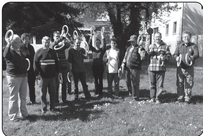
vibroswing mit den smoveys

Smoveys, das sind Schwingringe aus Spiralrohr, in denen sich 4 Stahlkugeln befinden, die sich bewegenden Kugeln sorgen für ein pulsierendes, vibrierendes Gefühl in der Hand.