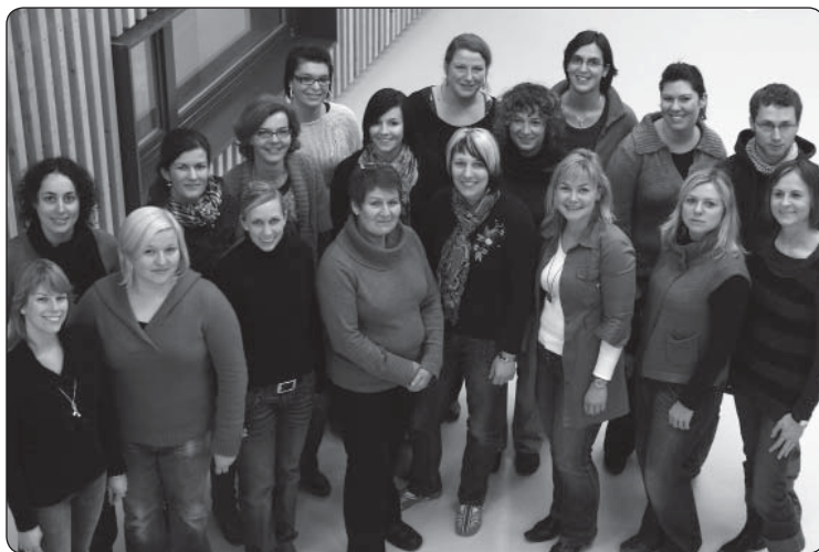
das Team der integrativen Kindertagesstätte

Bei wöchentlichen Teamsitzungen wurde und wird reflektiert und geplant. Der Austausch unter den Fachkräften ist wichtig, um lückenlos den Informationsfluss zu gewährleisten. Nach zwei Wochen gingen die Fachkräfte in den regulären Schichtdienst über und jede Gruppe gestaltete den Alltag nach dem Bedarf der Kinder. Mittlerweile erklingt mehrfach täglich Musik in der KITA und die Kinder können durch viel Bewegung ihre Umwelt entdecken und erleben.