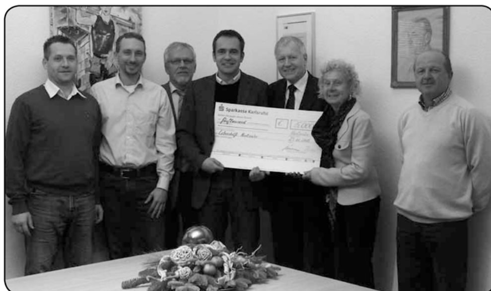
Spendenübergabe bei der Th. Trautmann GmbH

Ende November fand die Spendenübergabe im Hause des Karlsruher Traditionsunternehmens statt.