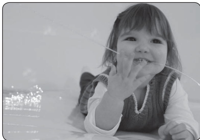
Entspannen und wohlfühlen im Snoezel-Raum

Die farbliche Gestaltung der Räumlichkeiten half den Kindern sich zurechtzufinden. Der Flurbereich sowie die Funktionsräume wie Snoezelraum, Gymnastik und Einzelförderraum haben einen gelben Bodenbelag. Der Fußboden in den Gruppenräumen ist in den Farben Grün, Blau, Orange, Türkis oder Rot gehalten. Die farbliche Gestaltung bietet den Kindern Struktur und hilft ihnen, sich zu orientieren. In der Eingewöhnungsphase haben wir die Kinder und ihre Eltern begleitet, unterstützt und manche kleine Träne beim Abschiedsmerz getrocknet. Durch intensive Gespräche konnten wir Ängste und Sorgen der Eltern abbauen.