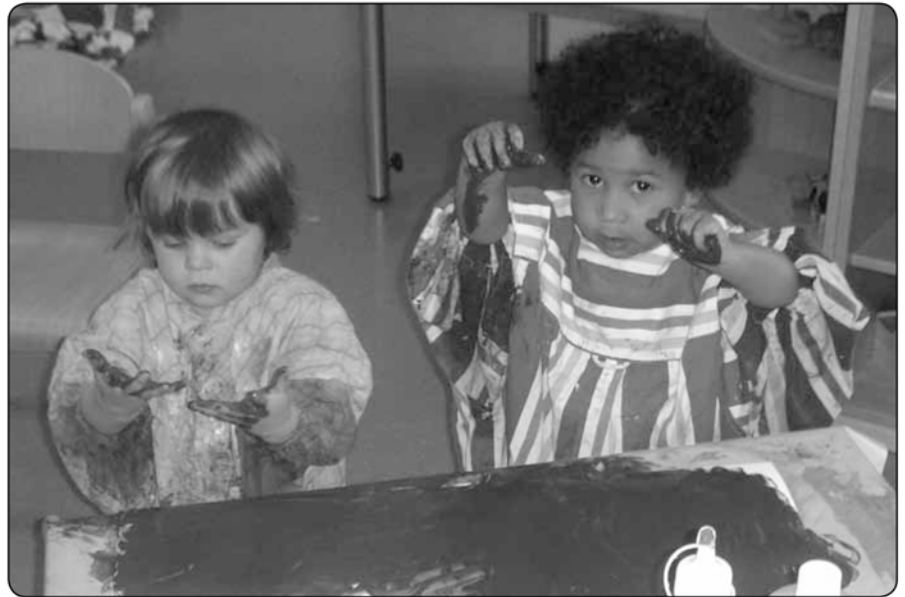
kreativ und künstlerisch

Seit September 2010 bietet das Badische Konservatorium „Musikmäuse“ und „Musikalische Früherziehung“ in unserem Hause an. Ergotherapie und Physiotherapie können auf Rezeptbasis, während der Betreuungszeit, in den Räumlichkeiten der KITA stattfinden. Dies ist eine Erleichterung für die Eltern sowie eine Bereicherung für uns Fachkräfte. In Gesprächen können wir uns austauschen und Informationen über die Zielsetzung der Stunden und die Entwicklung des Kindes erhalten.